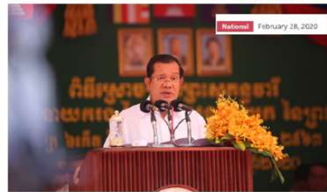
Prime Minister Hun Sen gives a speech today.

Prime Minister Hun Sen today announced that a part of Lvea Aem district, Kandal province, located east of Chaturmuk river will be upgraded to a district of Phnom Penh. The announcement was made amid the construction of bridge crossing Mekong river linking Chroy Chongva area to Arey Ksat area, Lvea Aem district, Kandal province which has been revealed to be built in the upcoming days.